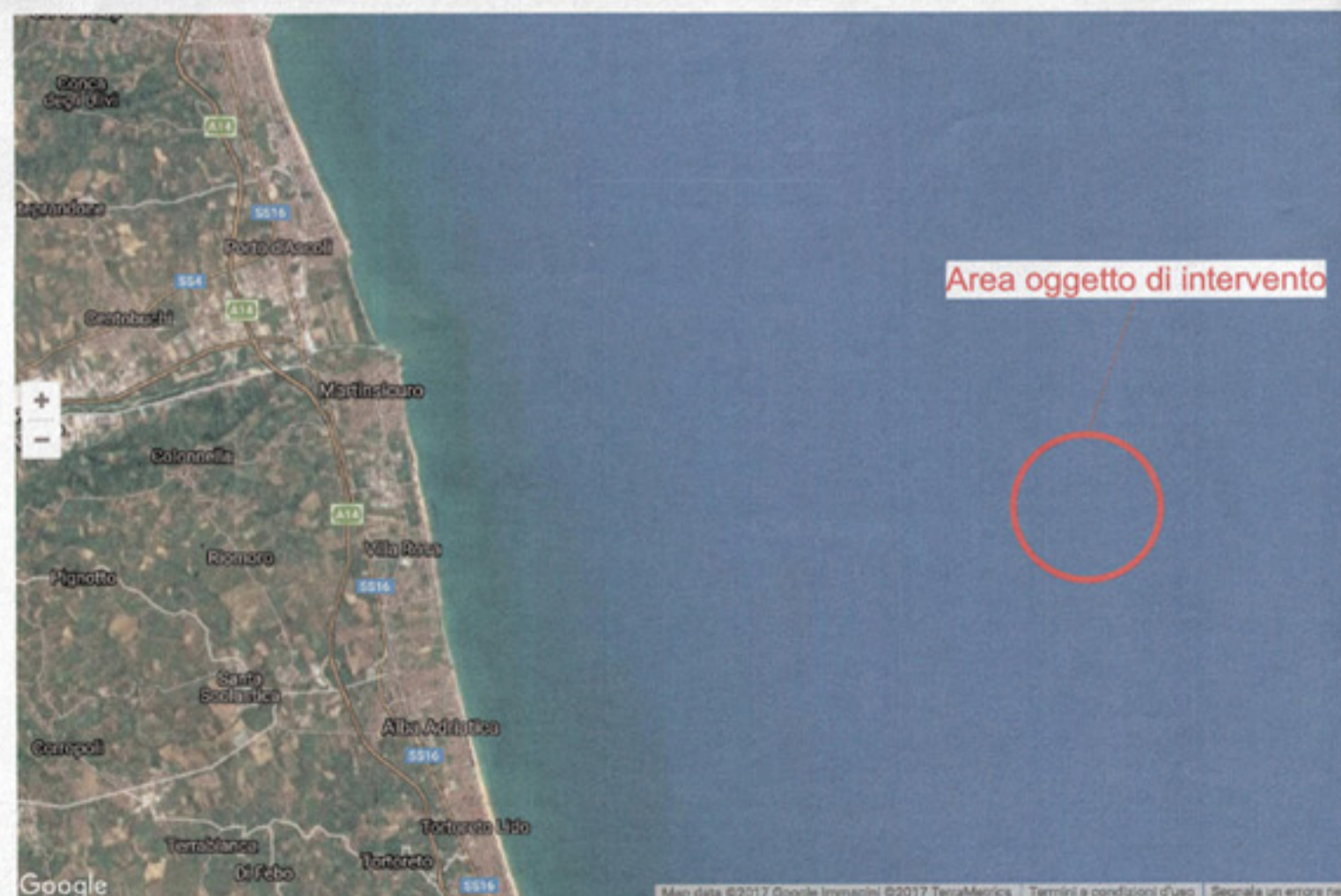
Planimetria da immagine satellitare