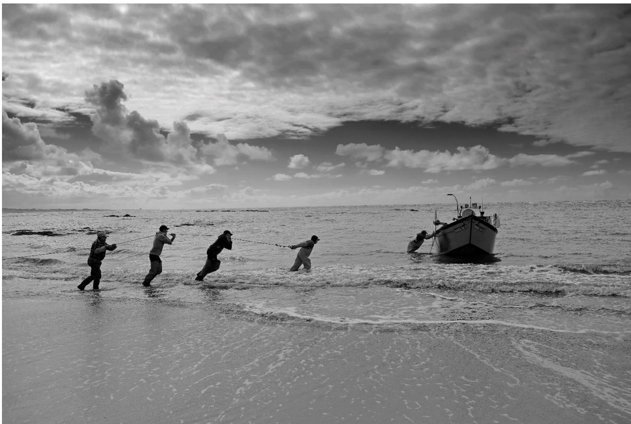
"Pescadores chegando à praia após noite de faina" di Jorge Meira (Portogallo)

Vincitore assoluto del concorso è Jorge Meira, in rappresentanza della regione partner Alto Minho (Portogallo), che sarà premiato con la partecipazione alla cerimonia di apertura della mostra fotografica che si terrà a Palma di Maiorca dal 15 al 18 Aprile 2020.