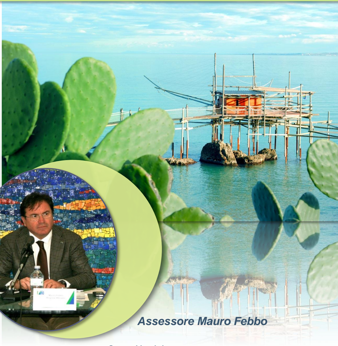
Assessore Mauro Febbo

Regione Abruzzo Direzione Politiche Agricole e di Sviluppo Rurale, Forestale, Caccia e Pesca, Emigrazione Via Catullo, 17 65127 – PESCARA