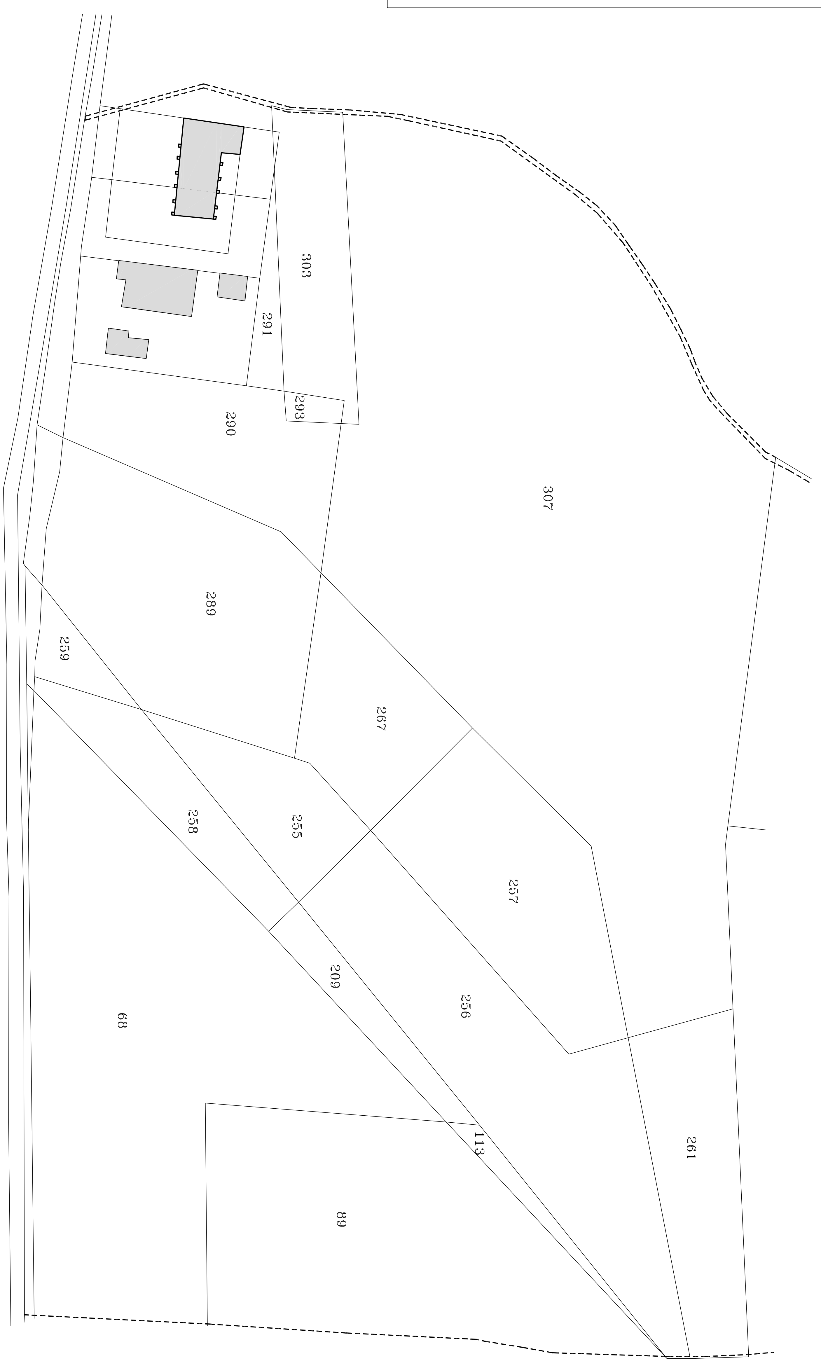
PLANIMETRIA CATASTALE Scala 1:1000