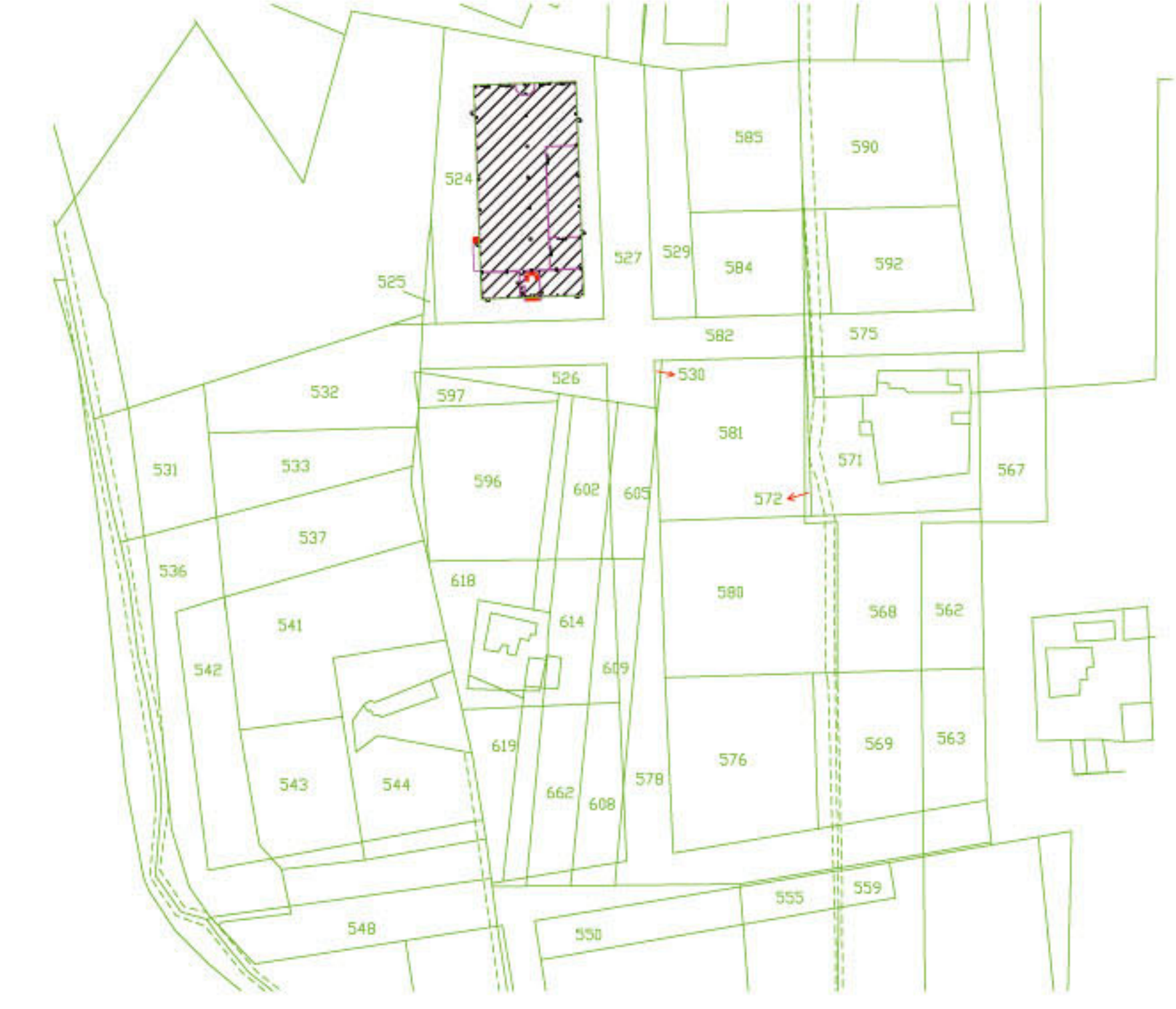
PLANIMETRIA CATASTALE scala 1:2000 FOGLIO N. 36 PARTICELLA N. 254