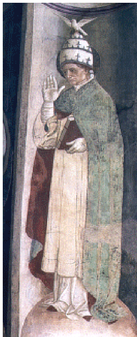
A destra: 20- A. de Litio. San Gregorio Magno , sec. XV (seconda metà). Affresco. Cattedrale di Atri, pilone ottagonono del Coro dei Canonici.