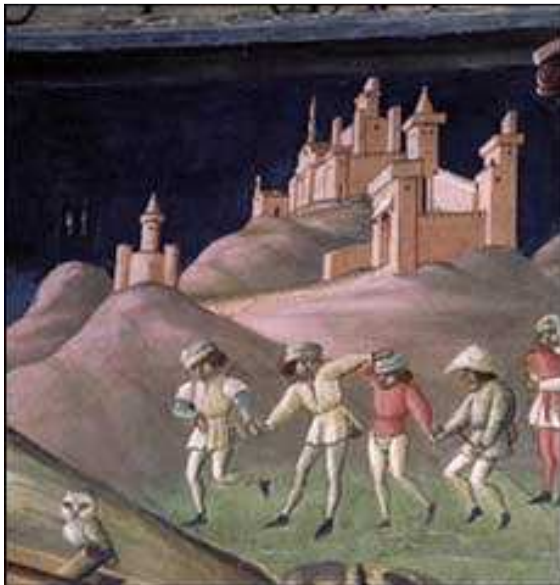
7- A. de Litio. Natività , sec. XV (seconda metà). Particolare con il Castello. Cattedrale di Atri, Coro dei Canonici.

Esse rappresentano quindi un esempio di relazioni tra correnti pittoriche di diversa origine, di scambi reciproci in una sorprendente osmosi di poetiche e di tendenze.