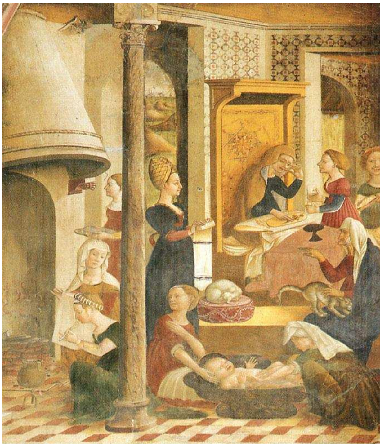
15- A. de Litio. Nascita della Vergine , sec XV (seconda metà). Cattedrale di Atri, Coro dei Canonici.

In questi affreschi è evidente “... la singolarissima natura del pittore, consapevole del rinnovamento rinascimentale ma volutamente alieno da qualsivoglia costrizione e condizionamento della sua singolare visione del mondo...” (Torlontano), come pure l'utilizzo di soluzioni iconografiche originali, attinte con fantasia alla versione apocrifia dei Vangeli, scene sempre fresche e vivaci, d'impatto immediato per poter meglio attirare l'attenzione dei fedeli, inserite in un spazio concepito ormai secondo le regole universali di Piero della Francesca.