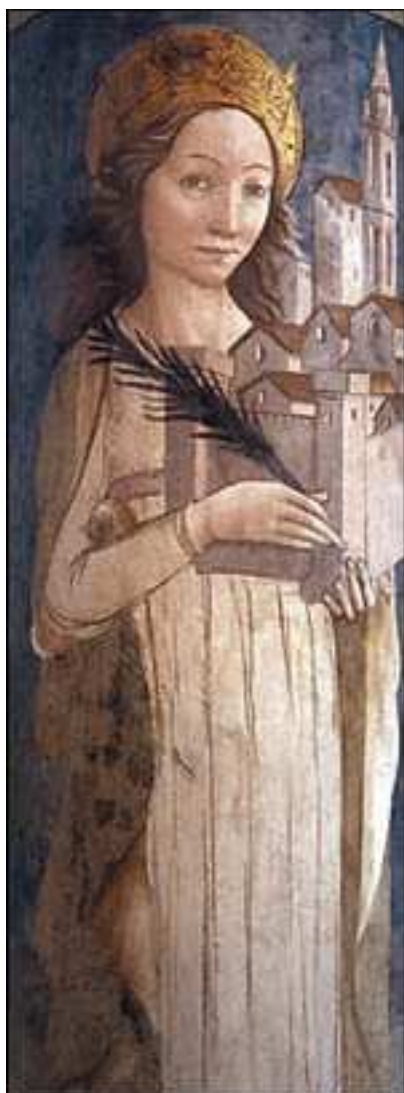
A sinistra: 19- A. de Litio. Santa Reparata , sec. XV (seconda metà). Affresco. Cattedrale di Atri, pilone ottagonono del Coro dei Canonici.