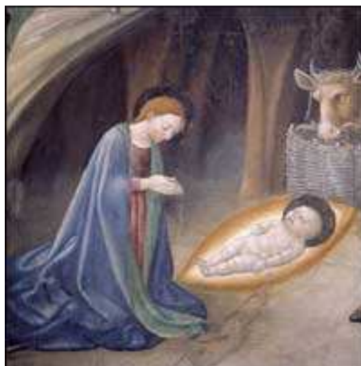
14- A. de Litio. Natività , sec. XV (seconda metà). Partic. con la Madonna adorante il Bambino. Cattedrale di Atri, Coro dei Canonici.

Negli episodi della Nascita di Cristo e nei volti dei personaggi raffigurati sui pilastri degli archi laterali, ma anche nel San Cristoforo di Guardiagrele, con l'immagine del Santo caratterizzata da una fisicità reale e da una nuova intensità psicologica, ritroviamo infatti il segno della loro poetica.