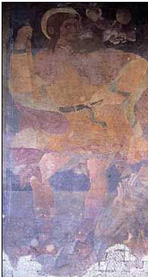
6- A. de Litio (firmato e datato). San Cristoforo , 1473. Guardiagrele, Chiesa di Santa Maria Maggiore, portico meridionale.

Di nuovo Andrea De Litio è documentato a Guardiagrele, dove firma e data, presumibilmente a circa cinquantatrè anni, l'affresco raffigurante San Cristoforo sulla parete del porticato meridionale della Chiesa di Santa Maria Maggiore: ANDREAS DE LITIO 1473 FECIT HOC OPUS .