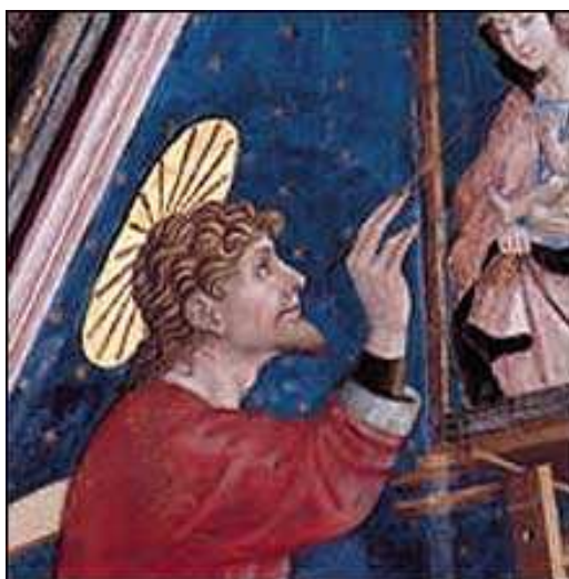
5- A. de Litio. San Luca , particolare. Cattedrale di Atri, volta del Coro dei Canonici