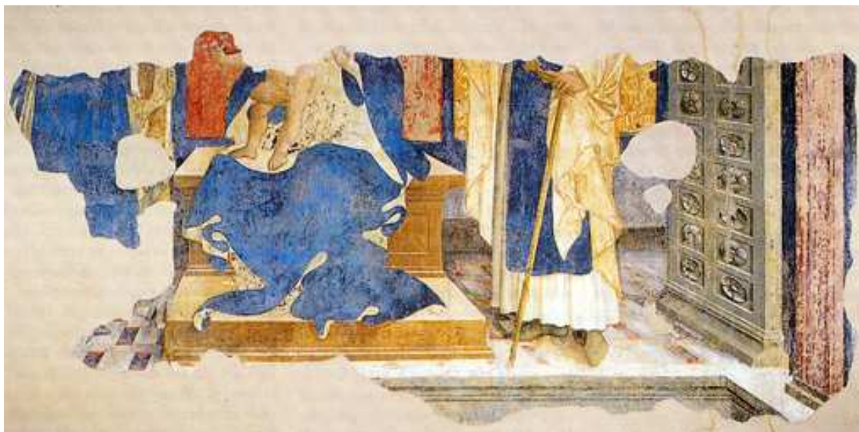
23- A. de Litio (attr.). Madonna in trono con Bambino e Santi , post 1481. Affresco staccato. Chieti, Museo Barbella.

Degno della nostra attenzione è il lacerto di affresco staccato dalla Chiesa di San Domenico a Chieti raffigurante una Madonna in trono e Santi, oggi conservata presso il Museo Barbella.