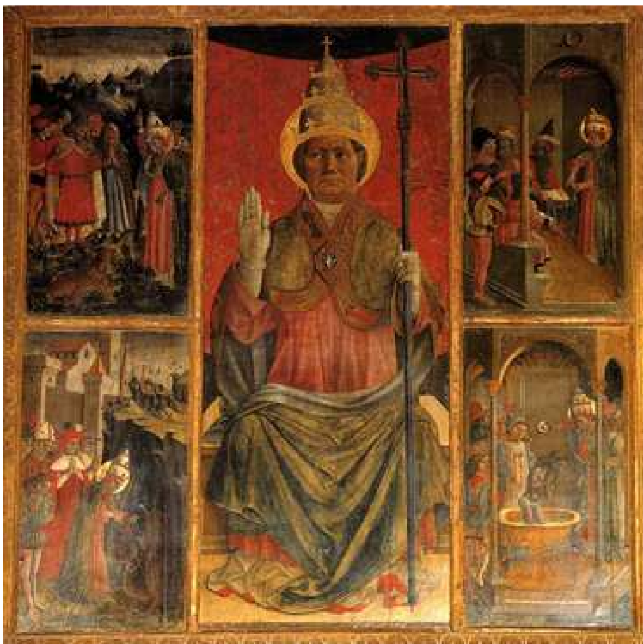
21- A. de Litio (attr.). Pala di San Silvestro , ca. 1480 (?). Tempera su tavola. Mutignano, frazione di Pineto (TE).