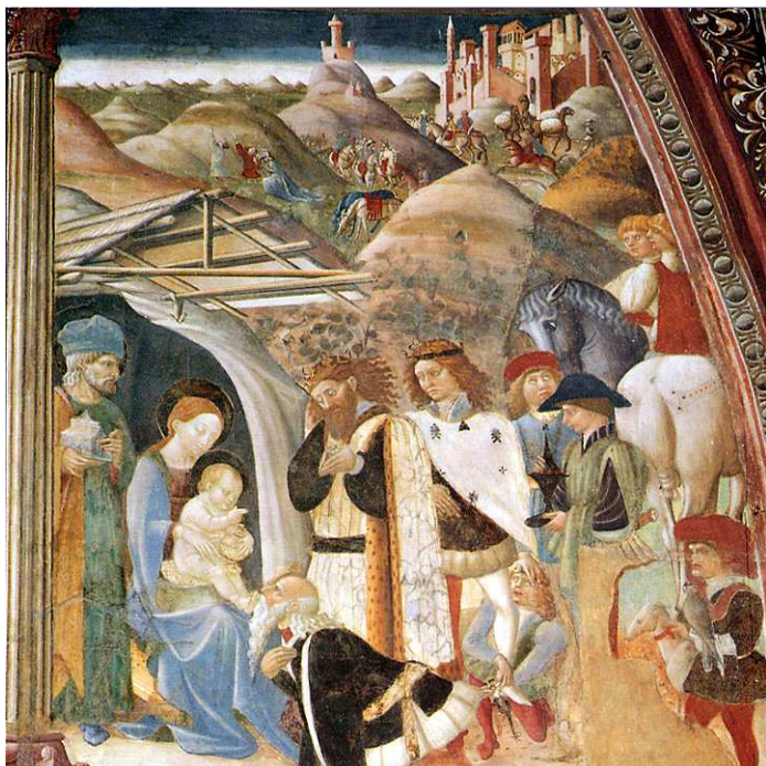
13- A. de Litio. Adorazione dei Magi , sec. XV (seconda metà). Cattedrale di Atri, Coro dei Canonici.

Negli episodi della Nascita di Cristo e nei volti dei personaggi raffigurati sui pilastri degli archi laterali, ma anche nel San Cristoforo di Guardiagrele, con l'immagine del Santo caratterizzata da una fisicità reale e da una nuova intensità psicologica, ritroviamo infatti il segno della loro poetica.