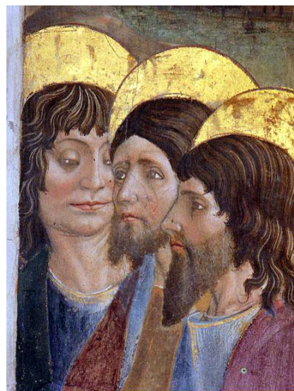
18- A. de Litio. Commiato dagli Apostoli , particolare. Sec XV (seconda metà). Cattedrale di Atri, Coro dei Canonici.

Il S. Silvestro di Mutignano è probabilmente successivo, comunque condizionato dagli affreschi atriani, vista la somiglianza dello stesso con un Pontefice raffigurato nel Coro di Atri e con il Vescovo Antonio Probi, morto nel 1482. La raffinata pala di San Silvestro, esprime, oltre alla cultura sopra ricordata, anche i progressi nell'acquisizione di una matrice figurativa che non ignora le ricerche pittoriche del Sassetta, dell'Angelico, del primo Veneziano, non esclusi gli originali accenti di Paolo Uccello.