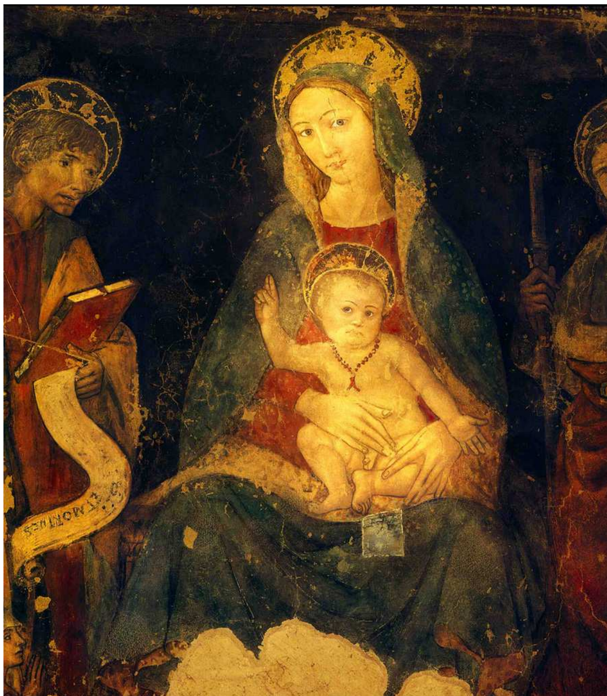
22- A. de Litio (attr.). Madonna con Bambino e Santi , 1480 (?). Affresco. Atri, Chiesa di S. Agostino, controfacciata.

Le stesse considerazioni riguardano anche la Madonna col Bambino e Santi che si trova nella chiesa di S. Agostino sempre ad Atri.