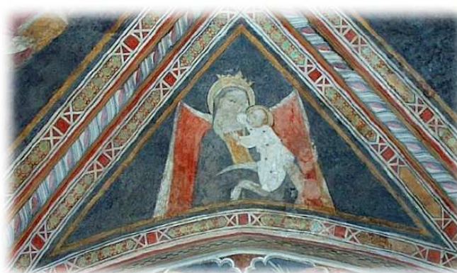
9- A. de Litio (attr.). Madonna in trono con Bambino , 1439-42. Affresco. Celano, Ch. di San Giovanni Battista.

Sempre secondo la sua opinione, inoltre, il Bambino rampante dalle forme masoliniane, affrescato nella quarta campata della chiesa di Celano, dove è stata accertata la presenza delle stesse maestranze di San Silvestro, dimostra la precocità dell'incontro con la cultura fiorentina da parte del pittore leccese.