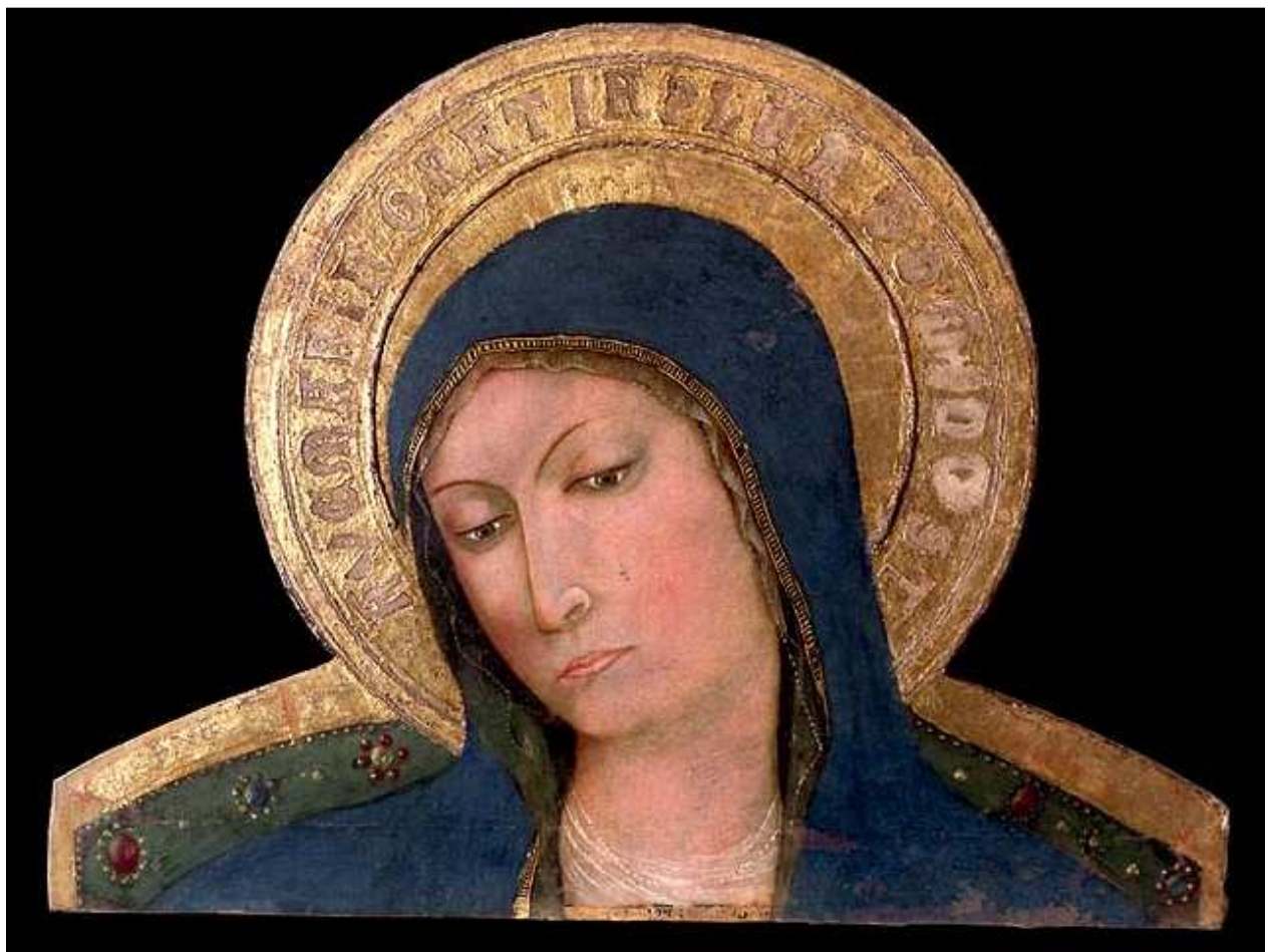
8- A. de Litio (attr.). Madonna in trono , detta Madonna di Cese , 1439-42. Tempera su tavola. Celano, Museo di Arte Sacra.

Sebbene la frammentarietà del dipinto non ne permetta la lettura nella sua completezza, la preziosa e raffinata Madonna, forse in trono, dal volto delicato nei lineamenti virginali, è interpretata con estrema sensibilità e maestria tecnica.