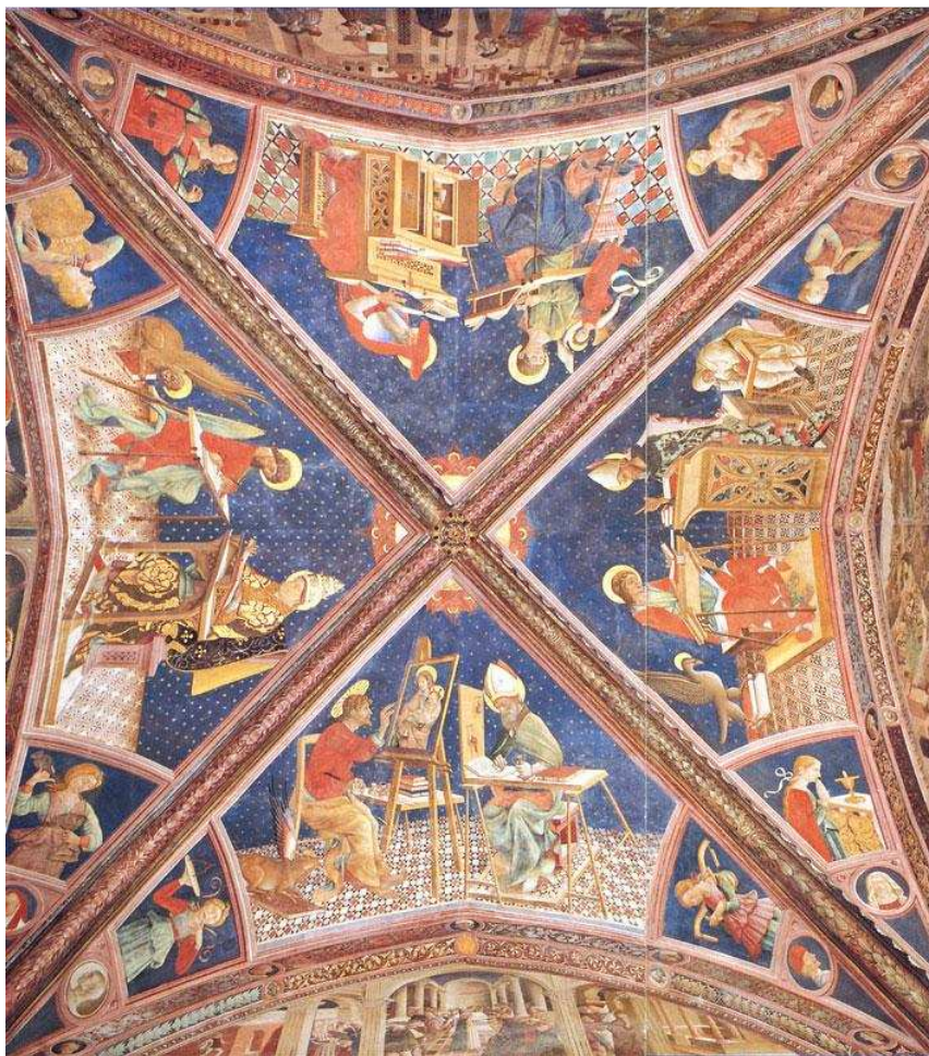
4- A.de Litio. I quattro Evangelisti , sec. XV (seconda metà). Cattedrale di Atri. Affreschi della volta del Coro dei Canonici