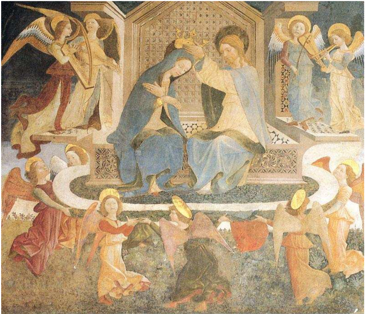
17- A. de Litio. Incoronazione della Vergine , sec XV (seconda metà). Cattedrale di Atri, Coro dei Canonici.

Tutta l'esperienza artistica extra abruzzese, coesiste e si fonde in questo ciclo pittorico che si vuole eseguito negli anni '80, ma che potrebbe anche essere retrodatato di oltre un decennio.