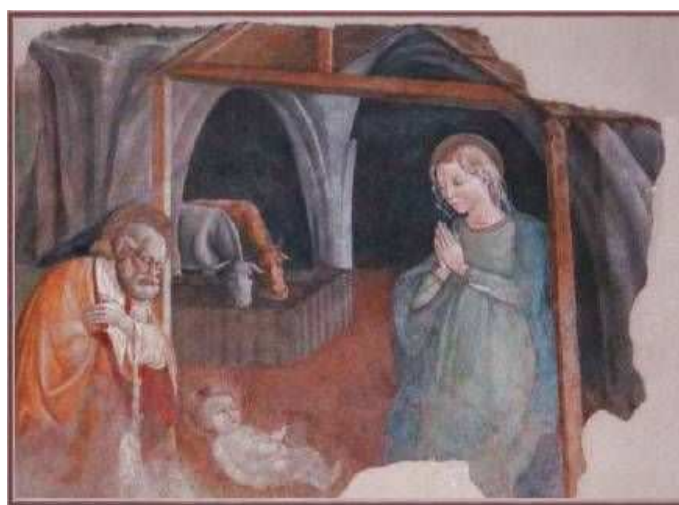
11- A. de Litio (attr.). Natività , ca. 1440. Affresco. L'Aquila, Oratorio della Beata Antonia.

Agli stessi anni si fa risalire la Madonna di S. Amico ed alcuni affreschi dell'Oratorio della Beata Antonia in Santa Chiara Povera, a L'Aquila, la Madonna col Bambino realizzata a Foligno, già nella collezione Corsi di Firenze e, secondo alcuni, anche quella del Palazzo Sanità di Sulmona, oltre alla tavola dimezzata che attualmente si trova presso il Museo Nazionale d'Abruzzo.