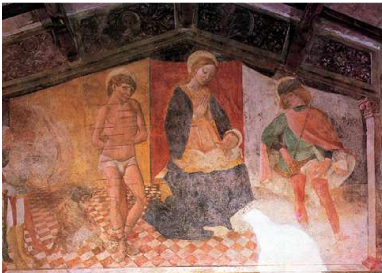
24- A. de Litio (attr.). Madonna con Bambino, San Sebastiano e San Rocco , sec. XV (seconda metà). Affresco. Isola del Gran Sasso, Cona di San Sebastiano.